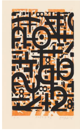
Jörg Seifert (A 4) Radierplatte als Hochdruck ü. Linolschnitt