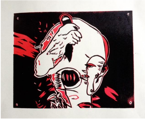
Wilhelm Schramm (A3) > Schmerz < Linolschnitt in der Technik der verlorenen Platte